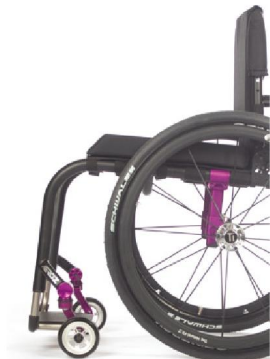
Einarmgabel mit integriertem „Rammschutz“