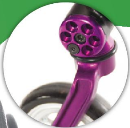
Speed Loader und Soft-Roll Vorderrad