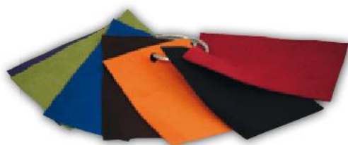
Wählbar: Farbe Alcantara-Streifen