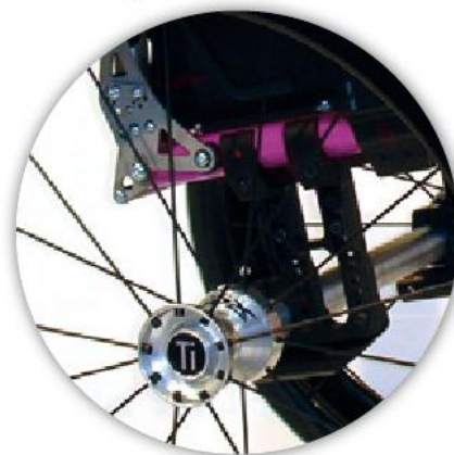
Tru-Fit System – Höhenverstellung der hinteren Sitzhöhe