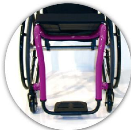
Rahmenverjüngung in zwei Maßen wählbar